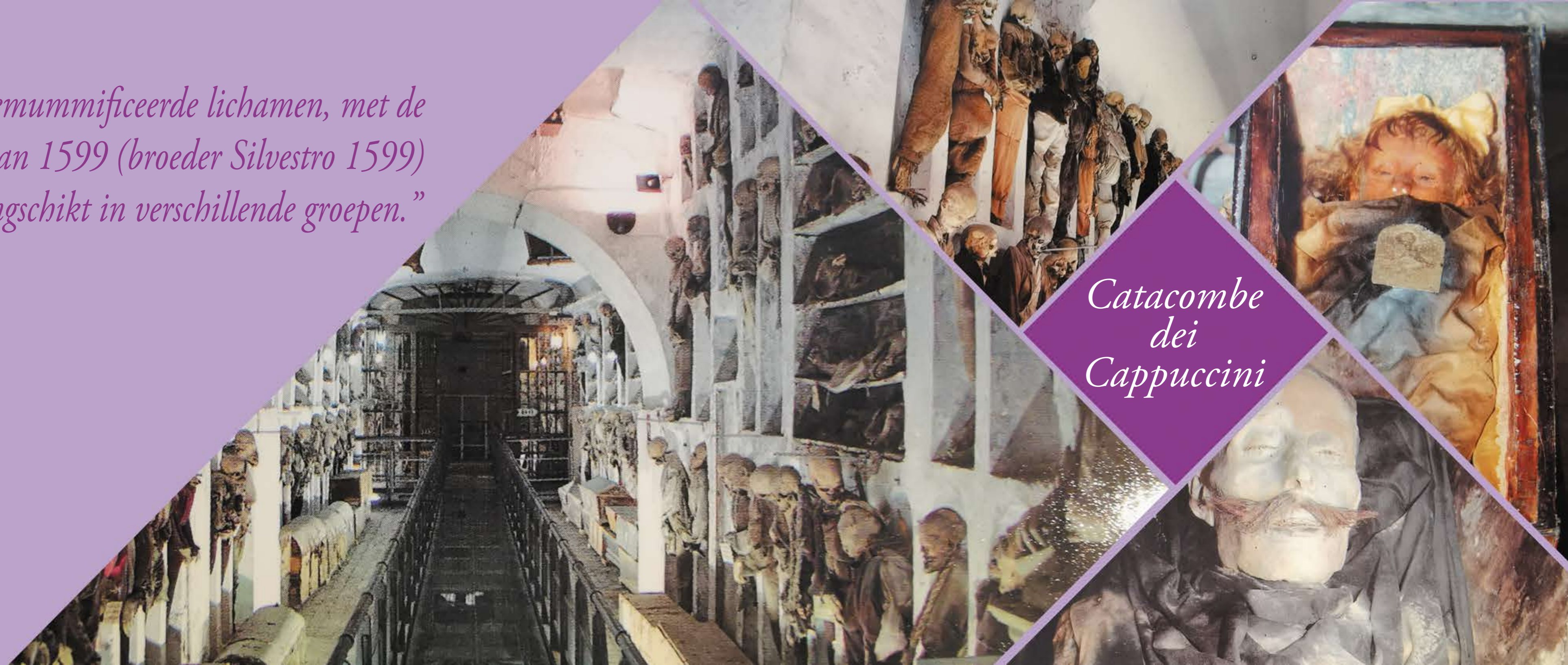
Catacombe dei Cappuccini

“8.000 gemummificeerde lichamen, met de oudste van 1599 (broeder Silvestro 1599) zijn gerangschikt in verschillende groepen.”