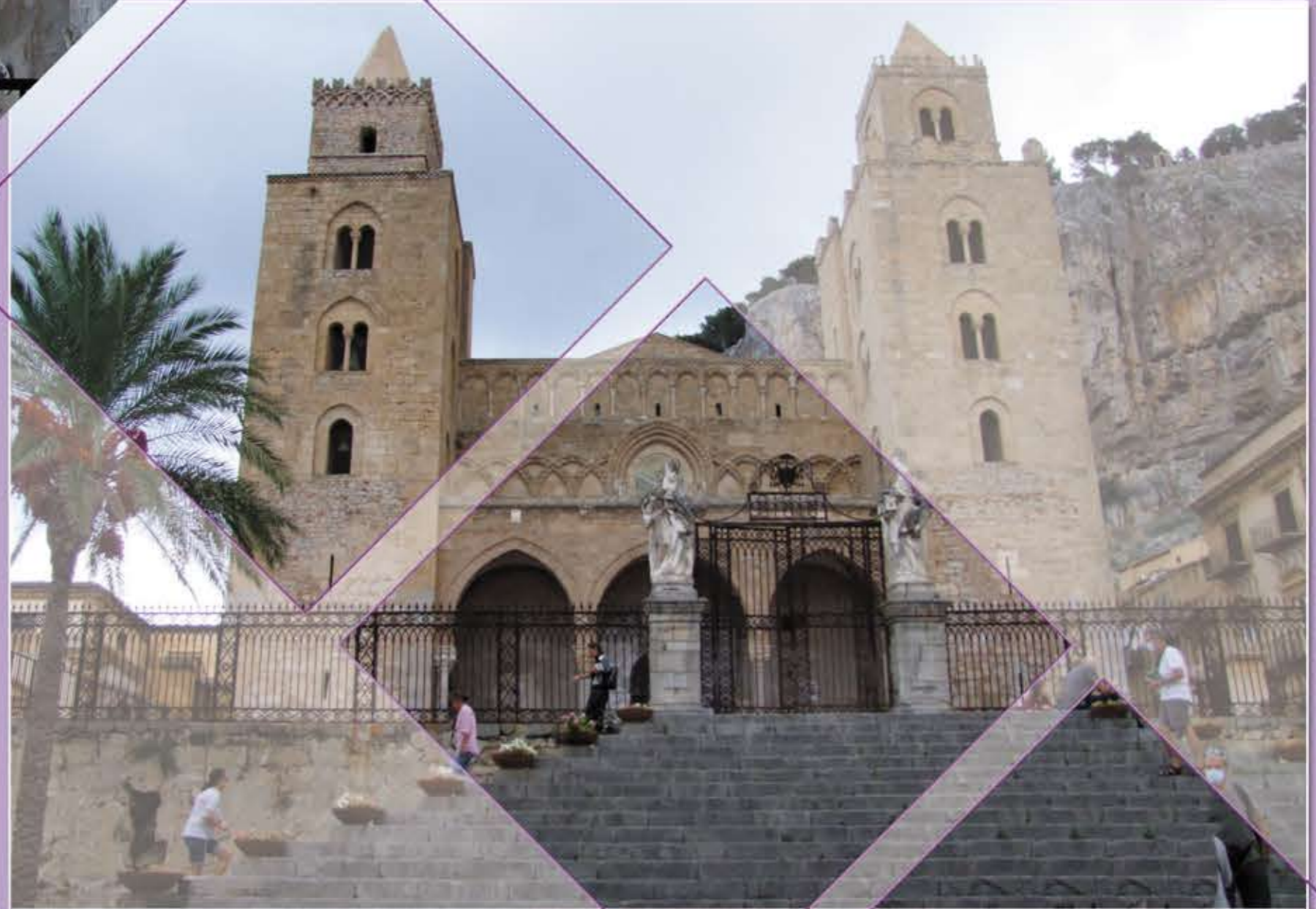
Duomo di Cefalù