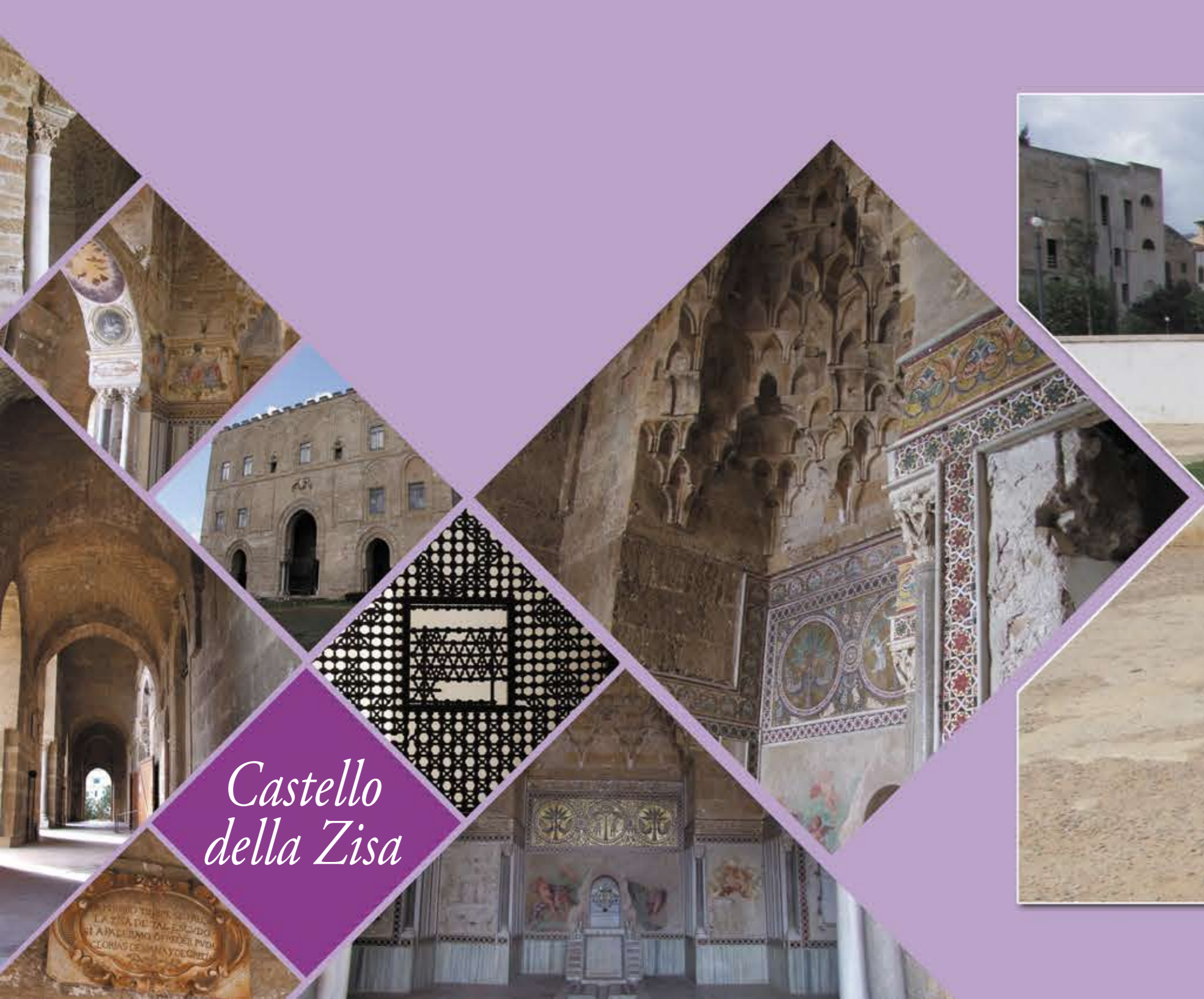
Castello della Zisa