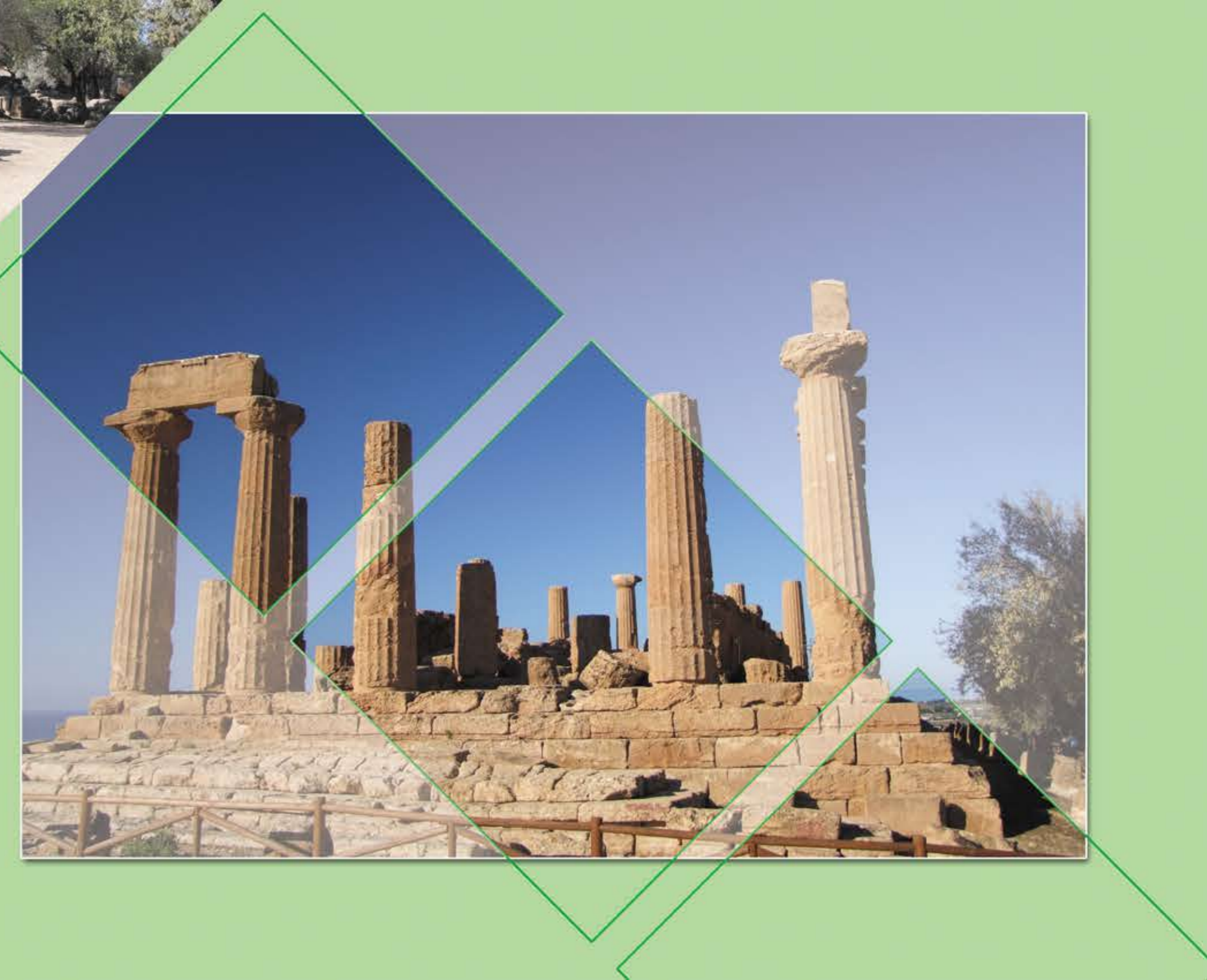
Juno en Appolo tempel