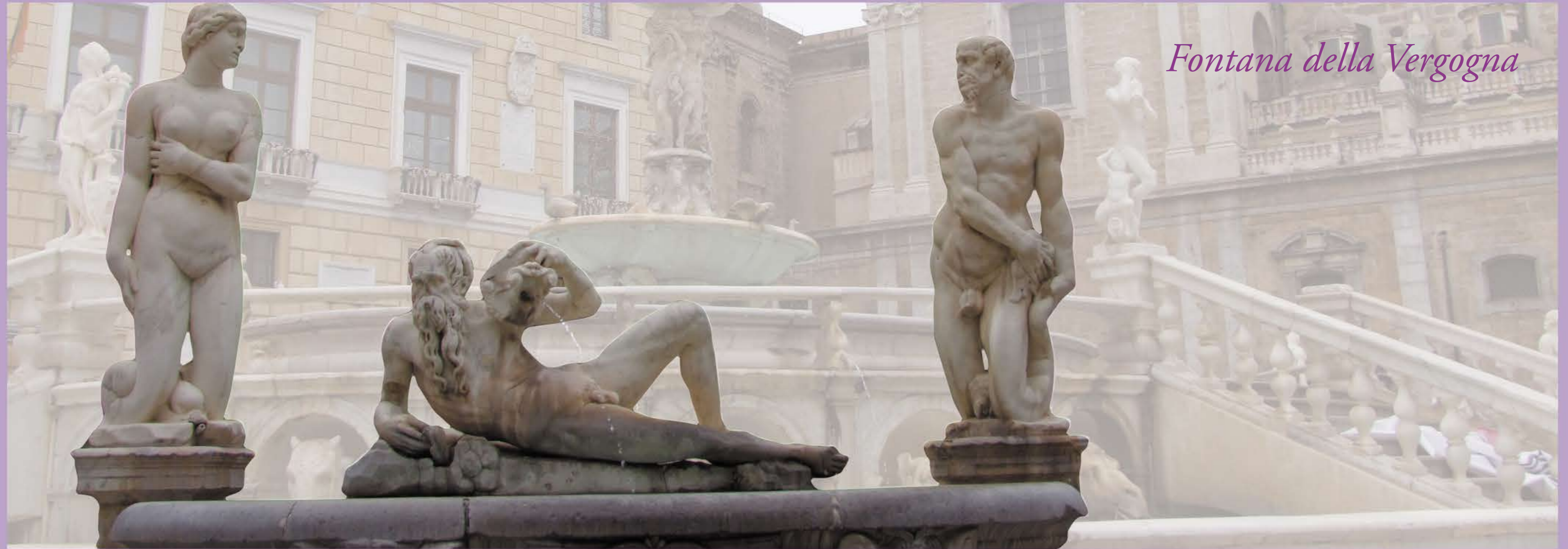
Fontana della Vergogna