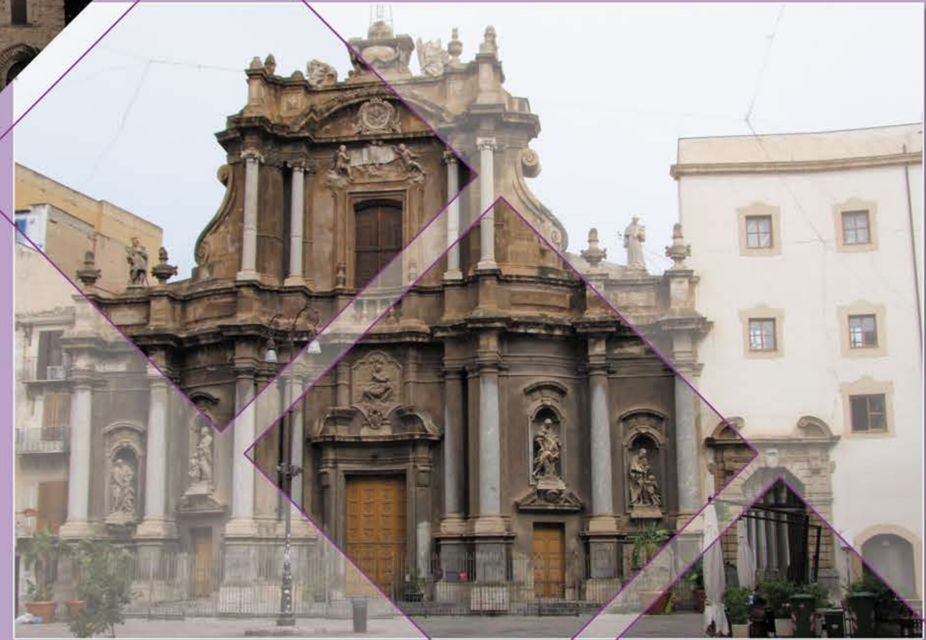
Kerken in Palermo