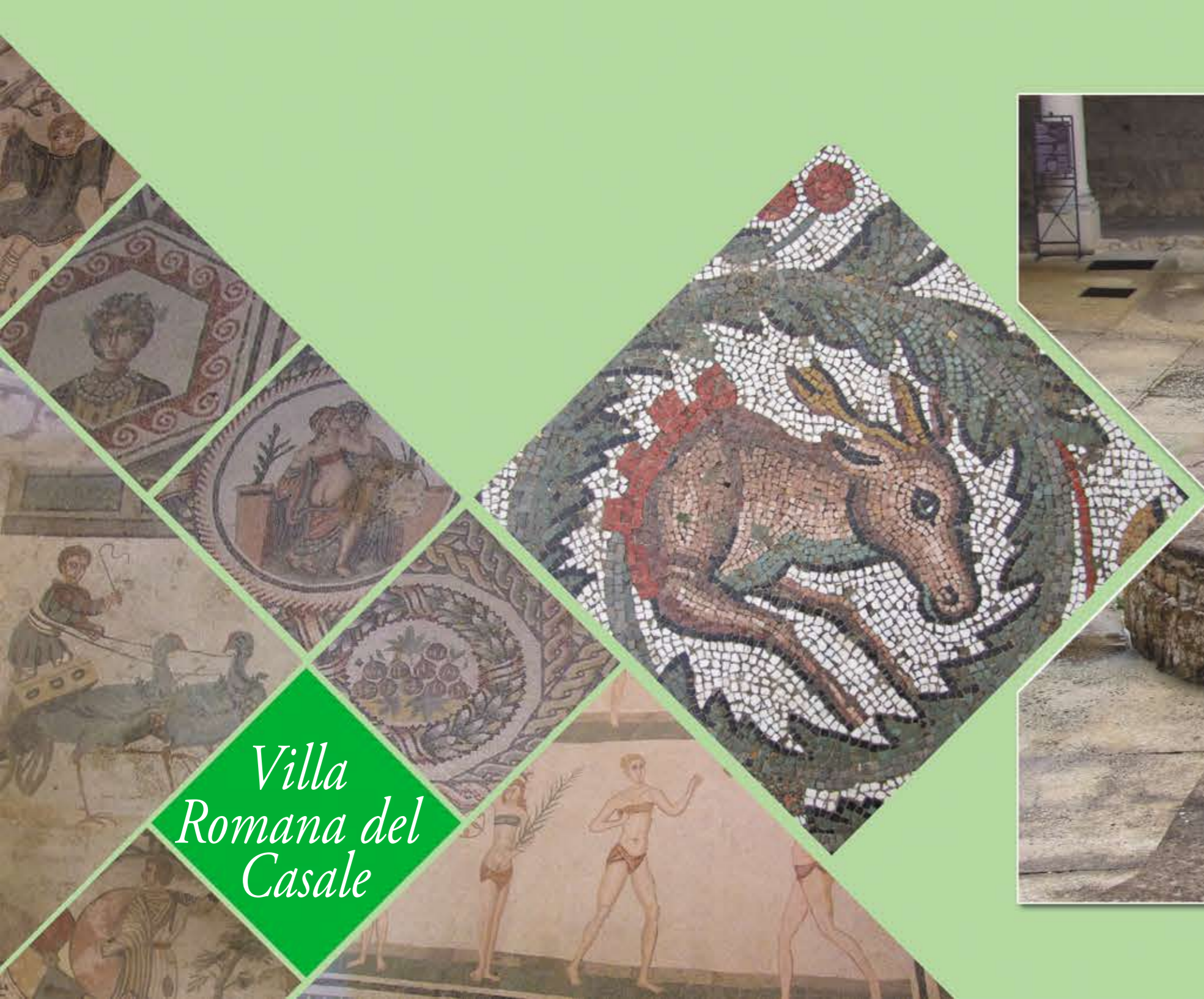
Villa Romana del Casale